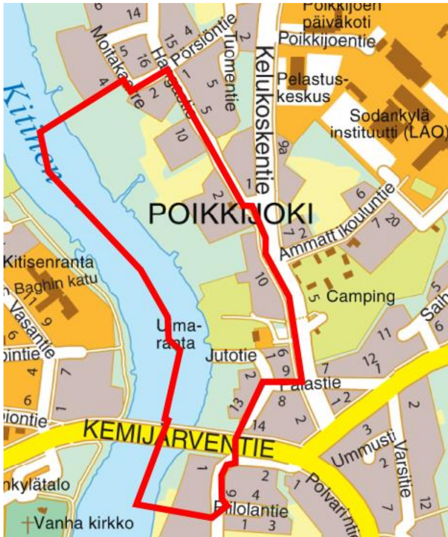
Liitekarta 1. Ote opaskartasta.