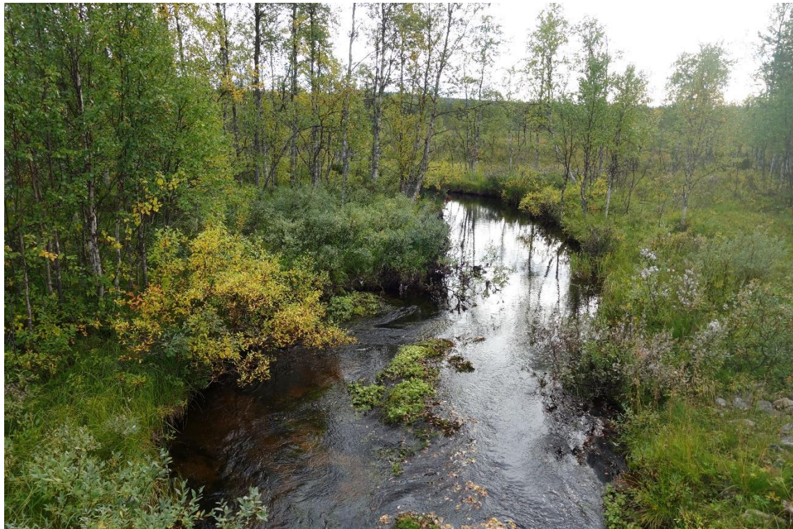
Selvitysalueen pohjoisosaa halkoo Iso-oja.

Selvitysalueelle, eteläosaan, sijoittuu yksi pohjavesialue.