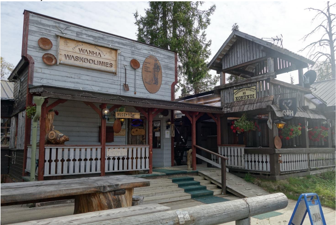
Kultakylän ravintola- ja majoitustoimintaa