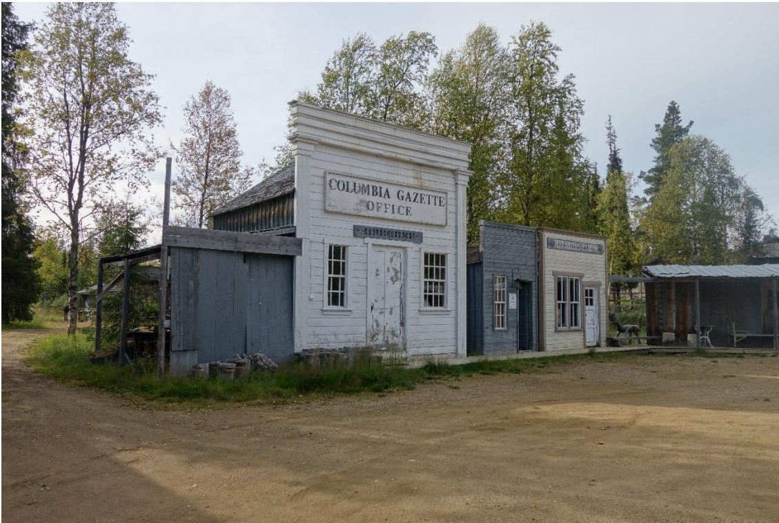
Kulissin omaisia rakennuksia Kultakylän alueelta