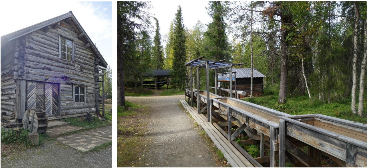
Rakennuksia ja rakennelmia Kultamuseon alueelta