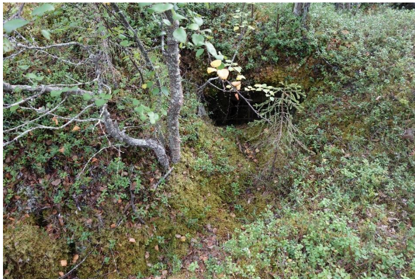
Osa saksalaista puolustusvarustusta

Sodankylän Tankavaarassa on Petsamoon johtavan entisen Jäämerentien poikki rakennetun saksalaisten "Schutzwall"-linjan entistettyjä varustuksia ja korsuja. Saksalaisten vetäytyminen edellytti puolustus- ja viivytysasemien rakentamista ja toinen näistä rakennettiin juuri Sodankylän Tankavaaraan. ( www.rky.fi )