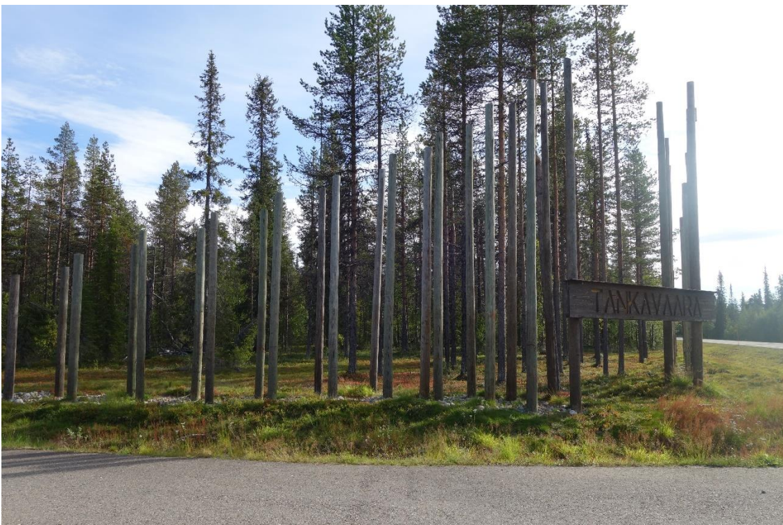
Tankavaaran eteläisemmän liittymän porttiaihe