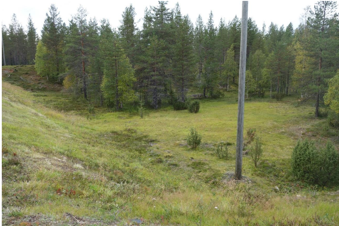
Purnumukantien eteläpuoliseen notkoon sijoittuva pieni, puoliavoin alue tuo vaihtelua valtatie sulkeutuneeseen tiemaisemaan.

vastapäätä eli valtatie 4:n länsipuolella reunametsän kuusista ja männyistä välittyy vähän erityisempi vaikutelma. Kuuset ovat hyvin kapeita ja ympäröivään puustoon verrattuna korkeita. Alueella on myös edustavia mänty-yksilöitä. Tankavaaran kultakylän alue sijoittuu valtatie 4:n varteen. Etäisyyttä ja väliin jäävää puustoa sen verran, ettei alue varsinaisesti näy tielle. Kultakylän sisäänkäynnin kohdalla on punamullan värinen puinen portti/aitarakennelma, joka on osin vinksallaan ja kaipaisi kunnostusta/uusimista. Kultakylän kyljessä olevan luontokeskuksen tienhaarassa on tyylikäs harmaantuneista puupylväistä koostuva porttiaihe. Samasta tienhaarasta pääsee myös kultamuseoon ja toista kautta Kultakylän alueelle.