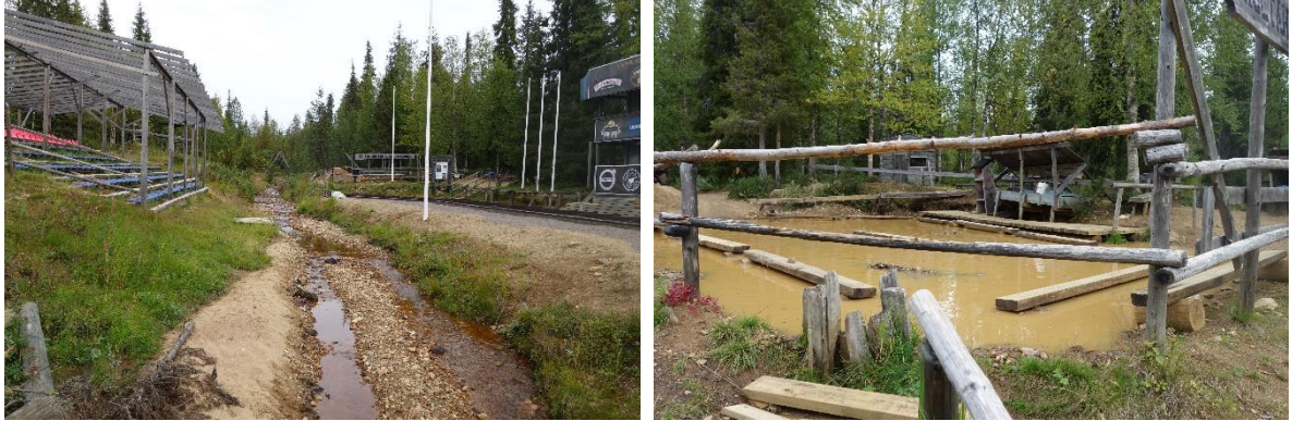
Kullanhuhdontakisoja varten on rakennettu katsomo (vas.), Kullanhuhdonta-alue (oik)

Tankavaarassa uudestaan vuonna 1970 ja 1975 alueelle perustettiin kultamuseo, joka on edelleen toiminnassa. Kultakylästä on kehittynyt suosittu matkailukohde, jossa järjestetään vuosittain kullanhuhdontakisat. (Lapin kulttuuriympäristöohjelma 1997)