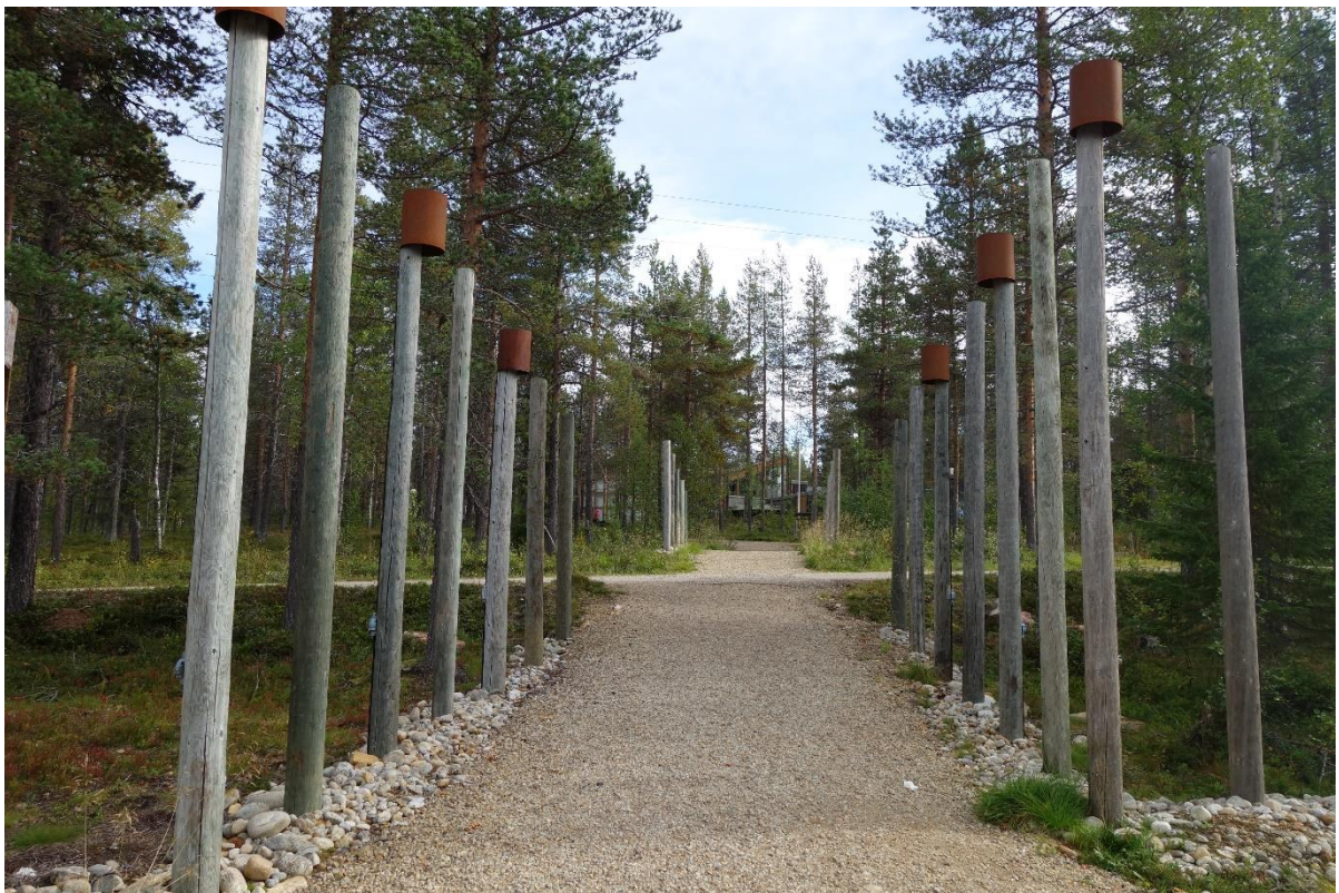
Luontokeskukselle johtava reitti

Noin puolet selvitysalueesta sijoittuu Urho Kekkosen kansallispuiston alueelle. Urho Kekkosen kansallispuisto on pinta-alaltaan Suomen toiseksi suurin kansallispuisto. Kyseisen kansallispuiston luonnon osatekijöistä olennaisia ovat tunturit, laajat suoalueet ja metsäiset kairat. Poroahoito on kansallispuiston alueella keskeinen elinkeino.