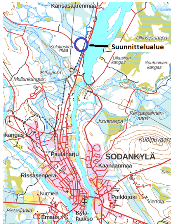
Kuva 1. Suunnittelualue.

Asemakaavan laadinta koskee Sodankylän kirkonkylän pohjoispuolelle sijoittuva aluetta. Alue sijaitsee noin 3,5 km kirkonkylältä pohjoisen suuntaan. Suunnittelualue on rajattu likimäärin tämän OAS:n liitekarttaan ( Liitekartta 1 ) sekä kansilehden karttaan.